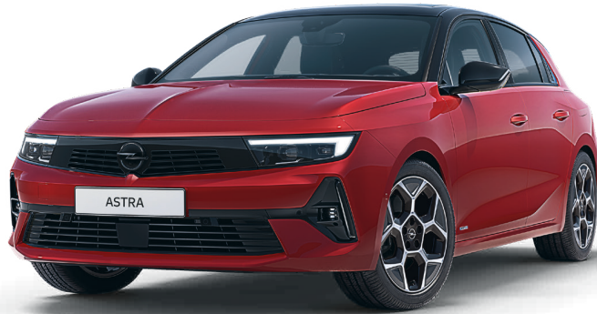
Beispielfoto der Baureihe Ausstattungsmerkmale ggf. nicht Bestandteil des Angebots