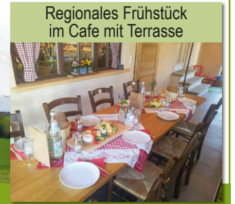
Regionales Frühstück im Cafe mit Terrasse