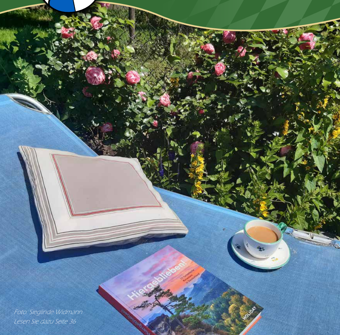
Lesen Sie dazu Seite 36